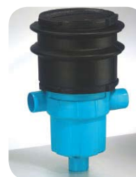
Filtr zbierający Garden