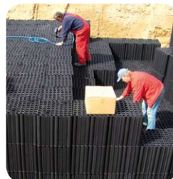
Przykładowa instalacja obejmująca kilka warstw modułów AquaBlok®

polega na ułożeniu w przygotowanym uprzednio wykopie półprzepuszczalnej geowłókniny, a następnie na umieszczeniu na niej, w zależności od parametrów gruntu (przepuszczalny, półprzepuszczalny lub nieprzepuszczalny) oraz ilości dopływającej wody deszczowej (w zależności od wielkości dachu i lokalizacji geograficznej obiektu) odpowiedniej ilości bloków (w poziomie lub w pionie). Po ułożeniu odpowiedniej ilości AquaBlok-ów, całość owija się geowłókniną. Tak wykonana instalacja zostaje zasypana gruntem.