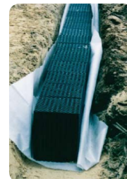
Przykładowa instalacja obejmująca jeden rząd modułów AquaBlok®