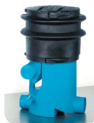
Filtr zbierający VF 1