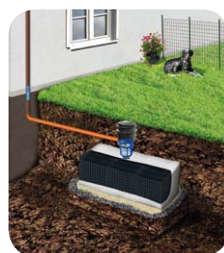
Instalacja rozsączająca z zastosowaniem filtra zbierającego GARDEN