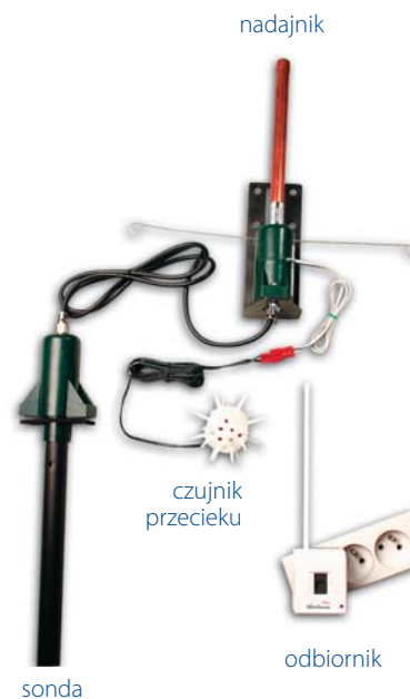
System „Watchman Plus”

Urządzenie Biotank jest przeznaczone do składowania i wewnętrznej dystrybucji biopaliw. Zostało ono zaprojektowane i wykonane, tak, aby jego eksploatacja była trwała, niezawodna i nie wymagała zbyt wielu zabiegów konserwacyjnych. Należy jednak pamiętać, że: